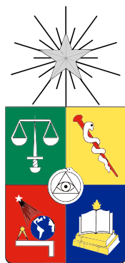
Figura 2: Escudo de la Universidad de Chile

A continuación la figura 2 presenta otra forma de agregar imágenes