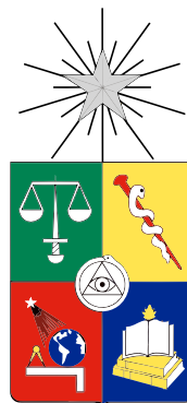
Figure 2: Escudo de la Universidad de Chile

A continuación la figura 2 presenta otra forma de agregar imágenes